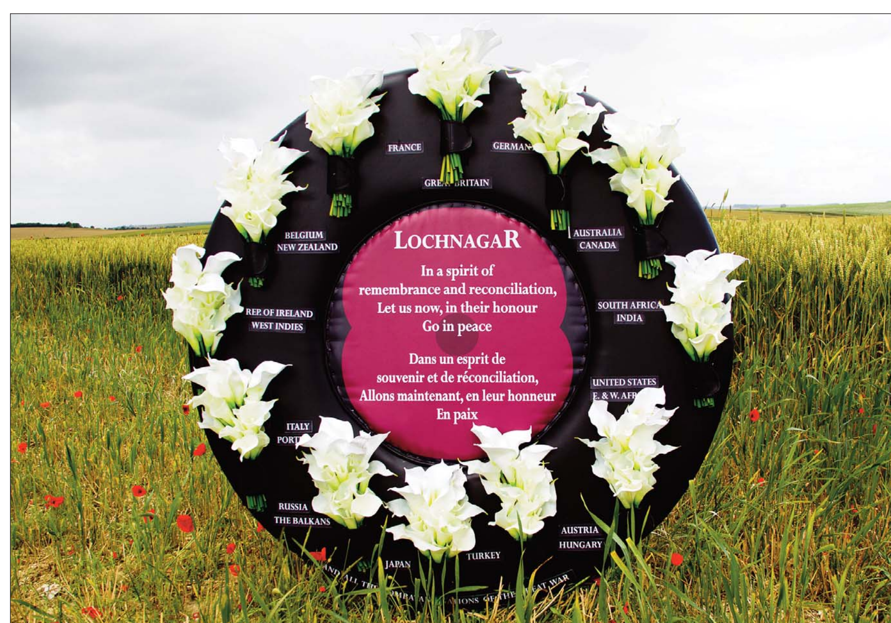
Top: At the going down of the sun... 1st July. Below: The Wreath of Reconciliation – Centenary 2016.